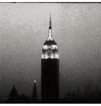
Şekil 3 - Empire State Building, Film karesi

yapımcılığına vermiş, Kiss, Empire ve Chelsea Girl'ü bu dönemde çevirmiştir. 1960'ların pop grubu, "The Velvet Underground" Atölye'de üretilmiş; ilk albüm kapakları Andy Warhol tarafından yapılmıştır. Pop simge ve kültlerine düşkün Warhol, kendisi de bir kült figür haline gelmiş ve "Popun Papası (Pope of Pop)" olarak anılmıştır. 1987'de basit bir safra kesesi ameliyatı sonrası komplikasyonlardan NewYork'da ölmüştür. 2 3