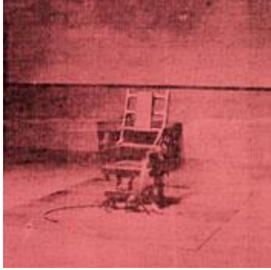
Şekil 9 - Serigrafi, Elektrikli Sandalye