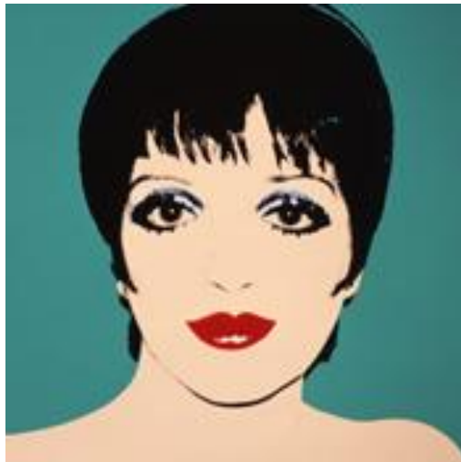
Şekil 7 Serigrafı, Liza Minelli