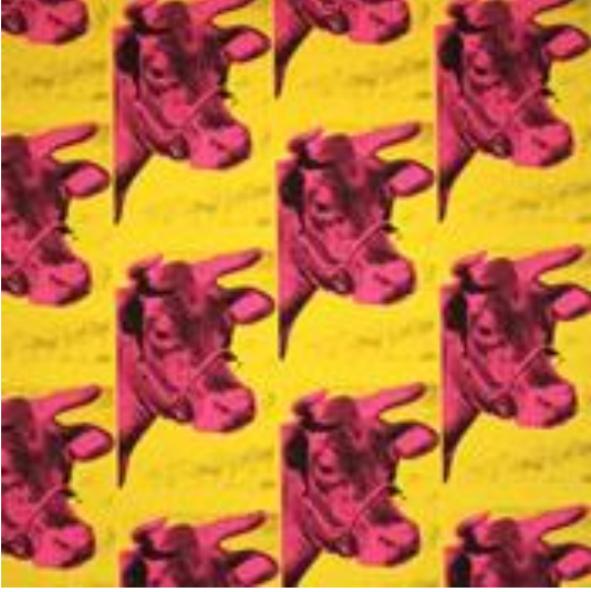
Şekil 8 - Serigrafi, İnekler