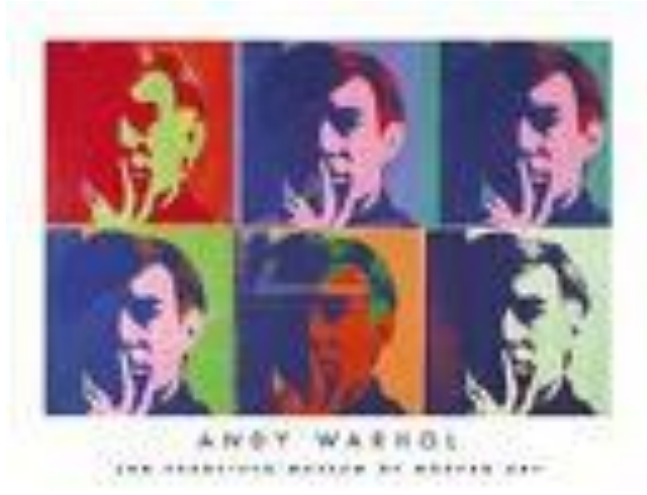
Şekil 12 - Serigrafi, Andy Warhol