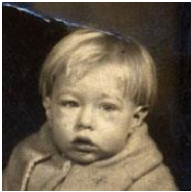
Şekil 1 - Andy Warhol, Çocukluğu

Andy Warhol 1928-1987 yılları arasında yaşamış Amerikalı ressam ve sinema yapımcısıdır. Çek göçmeni bir ailenin çocuğu olarak Pittsburg'da doğmuştur. 1954-1959 yılları arasında Carnegie Institute of Technology'de okumuş, daha sonra Newyork'da reklamcılık alanında teknik ressam olarak çalışmıştır. 1957'de Art Directors Club nişanını almıştır. 1960'ların başında gündelik, sıradan görüntülerden ve popüler ticari sanattan (film yıldızlarının dergilerde çıkan resimleri, reklamlar, çizgi romanlar, vs.) ilham alan tualler boyamaya başlamıştır.