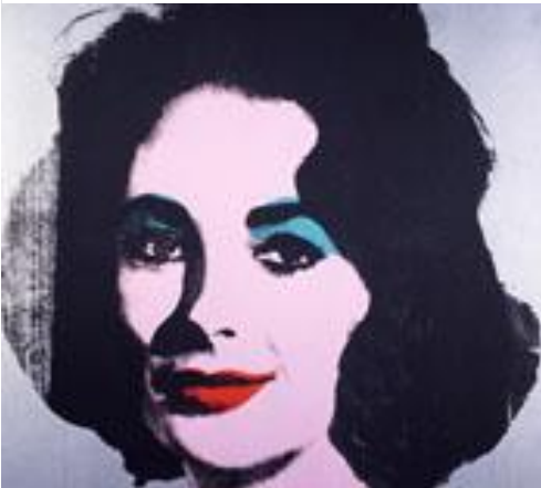
Şekil 6 Serigrafı, Elizabeth Taylor