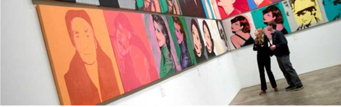
Şekil 10 - Pitsburg, Andy Warhol Müzesi