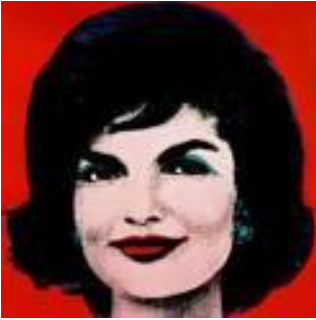
Şekil 4 - Serigrafi, Jacklyn Kennedy

4 Norbert Lynton, Modern Sanatın Öyküsü adlı eserinde Andy Warhol'un konularından bahsederken kitlelere mal olmuş imgelerin kullanımını özellikle vurgulamaktadır. Öyle ki, Marilyn Monroe, Elvis Presley, Elizabeth Taylor gibi film yıldızlarının yanı sıra Jackie Kennedy, Warhol'un kendisi gibi kamuoyunun bildiği başka kişiler ve suçlular, ayrıca elektrikli sandalye, otomobil kazaları gibi tüyler ürpertici konular ile inekler, çiçekler gibi zararsız konular da seçtiği temalar arasında yer almaktadır. Herkesce bilinen bu tür imgelerin tual üzerinde tekrar tekrar yinelenmesi ve zaman zaman az çok keyfi bir renk tabakasının da eklenmesiyle, ilgi çekici ölçüde muğlak sonuçlar elde ediliyordu. Bu yaklaşım ile bu imgeler gerçekte olduklarından daha bayağı, daha çekici ya da daha korkunç nitelikler kazanmış oluyorlardı. Böylece bir yandan bu resimlerin tekrarlanan yapılarından kaynaklanan monoton ve sıkıcı özelliği sevilmezken, öte yandan insanların hergün gözlerimizin önünde katledilmesinin, ya da bir takım çıkarlar uğruna tanınmış kişilerin sömürülmelerinin kolaylıkla kabullenilebilirliği fark ediliyordu. Nitekim Marilyn Monroe'nun 1962'deki ölümü basında yas tutma kampanyalarına yol açmıştı. Kennedy'nin 1963'de suikaste kurban gitmesinin ardından Jackie Kennedy'nin bir dizi resmi basılmış, siyahlar içindeki fotoğrafı pek çok kez tekrar tekrar yayınlanmıştı.