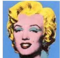
Şekil 2 - Serigrafi, Marylin Monroe

"The Factory – Atölye/Fabrika"adını verdiği stüdyosunda görüntüleri tekrarlamaya ve seri üretime duyduğu ilgi ile ürünler vermiştir. 1968-1972 yıllarında kendini avant-garde sinema