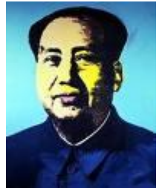
Şekil 5 - Serigrafi, Mao

Değerlerin içi boşalıyor, Che Guevara için söylenen hüznü şarkı süpermarketlerde çalınırken, Warhol, Mao'yu serigrafi ile çoğaltıp bir pop figürü haline getiriyordu. Şahıslar bile birer tüketim nesnesi, hatta